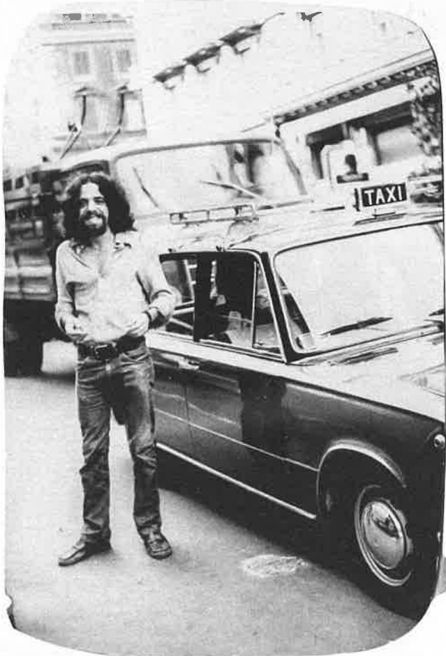
C'est depuis Amsterdam que l'écrivain a entrepris son voyage mystique.