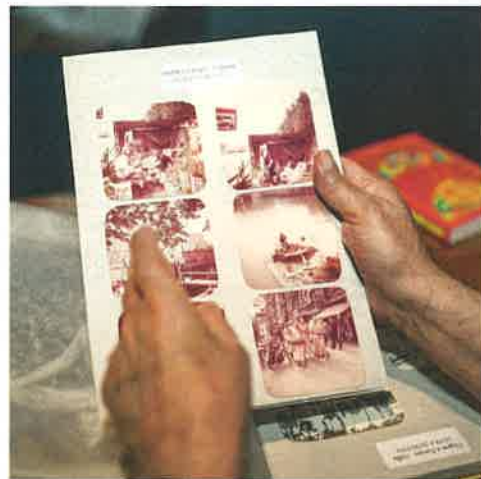
Quelques clichés de son « trip », qui le mena d'Amsterdam à Istanbul, en 1970.

Turquie, l'Iran, l'Afghanistan, l'Inde... Avec cent dollars en poche, on pouvait être du voyage. Le Magic Bus ne correspondait pas aux affiches de l'agence qui nous avait vendu les billets et qui représentaient un bus bariolé. Nous avons pris place à bord d'un vieux car scolaire. »